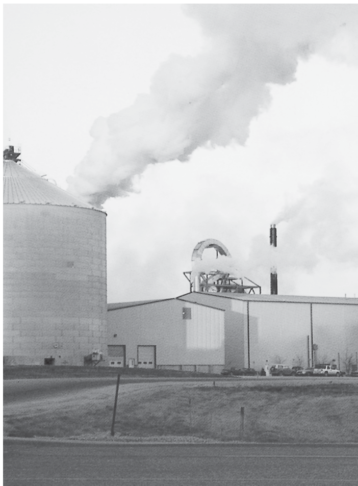
มลภาวะทางอากาศ (โรงงานอุตสาหกรรมปล่อยอากาศเสีย) ที่มา วารสาร นโยบายพลังงาน ฉบับที่ 71 มกราคม - มีนาคม 2549 หน้า 54