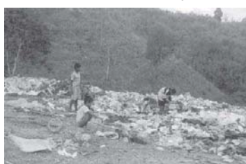
มลภาวะขยะ