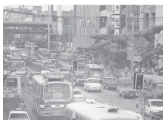
มลภาวะทางเสียง