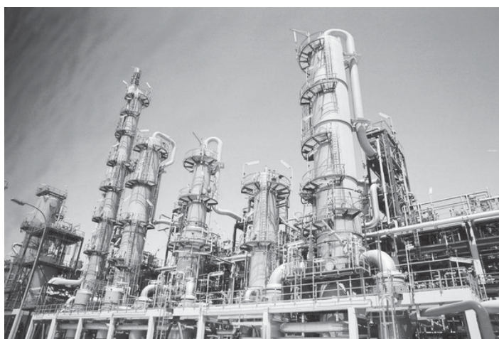
อุตสาหกรรมปิโตรเลียม