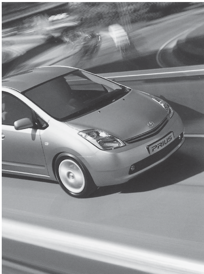
พลังงานทางเลือก (พลังงานไฮโดรเจน)