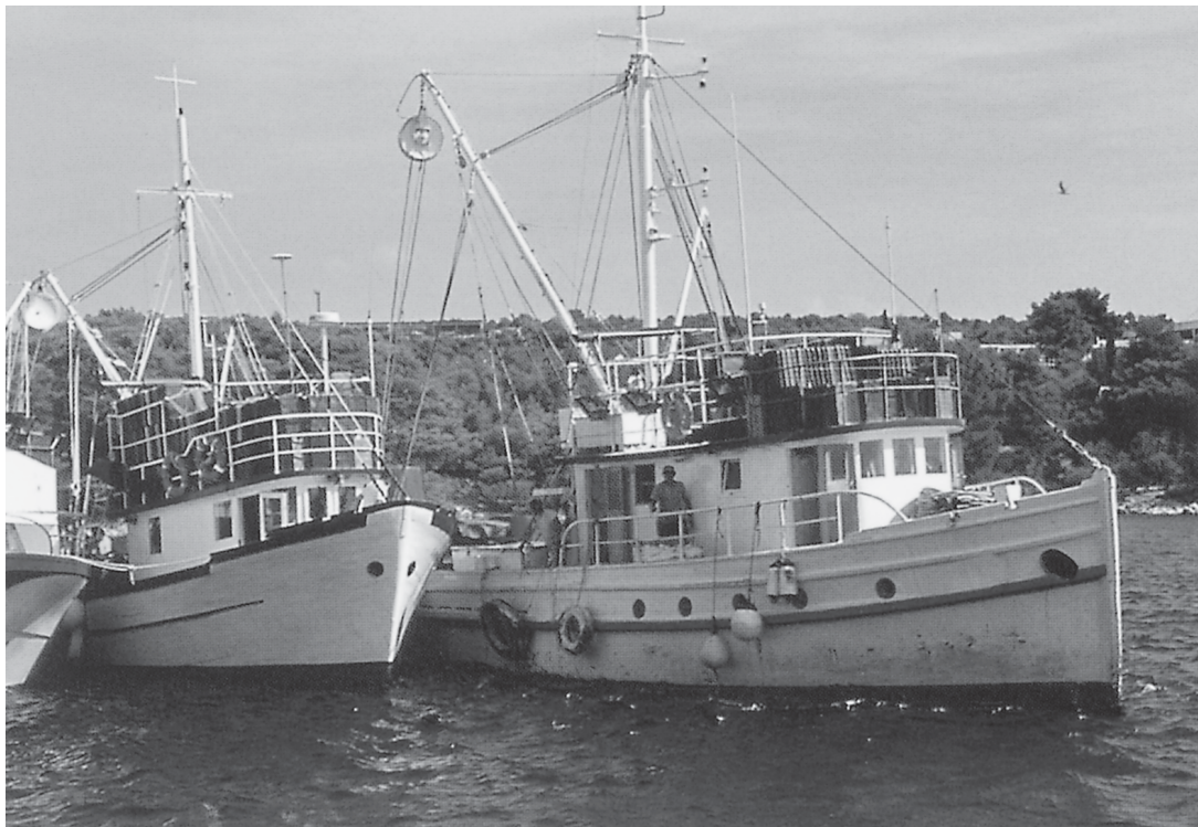
การประมงในน่านน้ำไทย