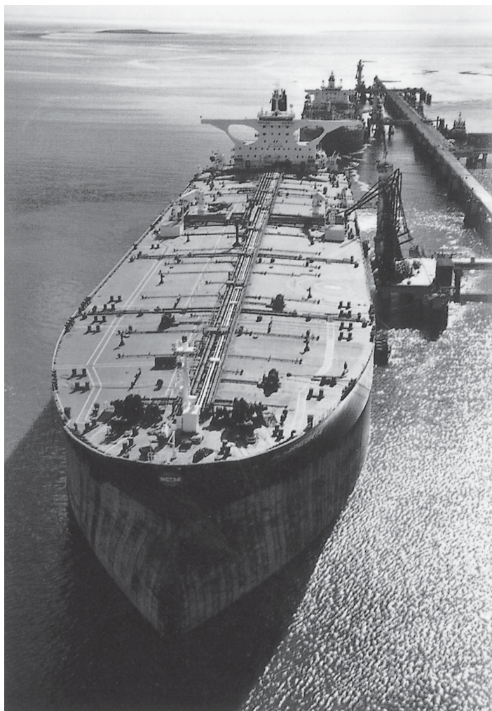
มลภาวะทางทะเล การขนส่งน้ำมันทางทะเล ที่มา วารสาร นโยบายพลังงาน ฉบับที่ 71 มกราคม - มีนาคม 2549 หน้า 50