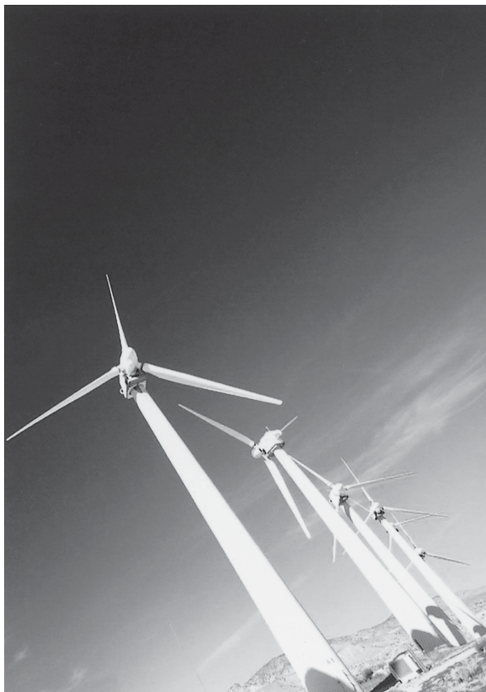
พลังงานทางลม (พลังงานทางเลือก) ที่มา วารสาร นโยบายพลังงาน ฉบับที่ 71 มกราคม - มีนาคม 2549 หน้า 53