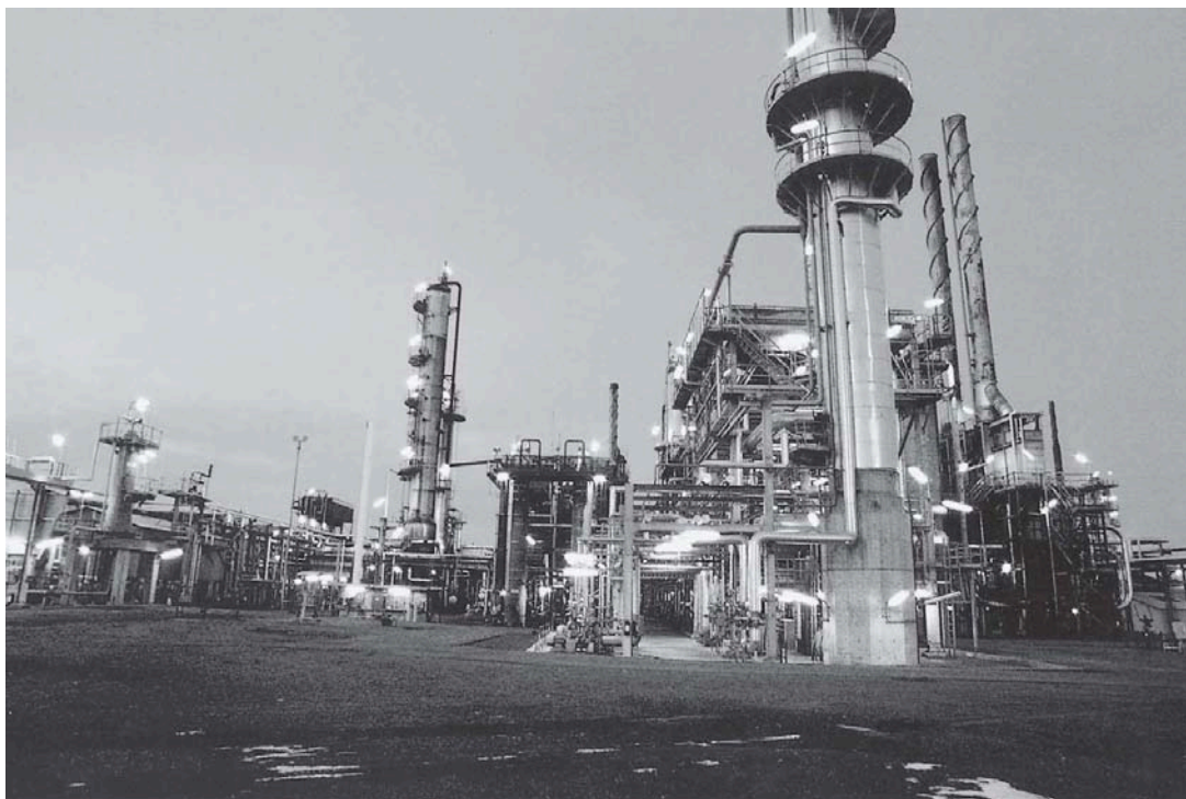
พลังงานก๊าซ (โรงแยกก๊าซ) ที่มา วารสาร นโยบายพลังงาน ฉบับที่ 71 มกราคม - มีนาคม 2549 หน้า 22