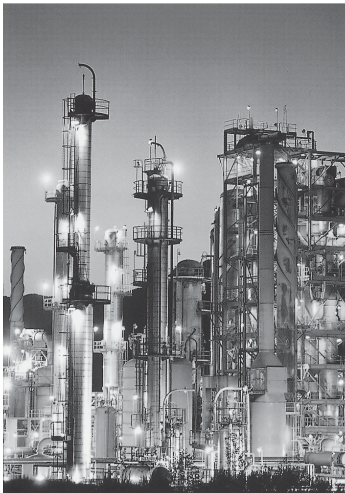
พลังงานไฟฟ้า โรงงานผลิตกระแสไฟฟ้า