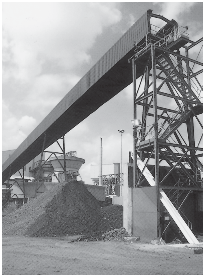
พลังงานถ่านหิน (พลังงานทางเลือก)