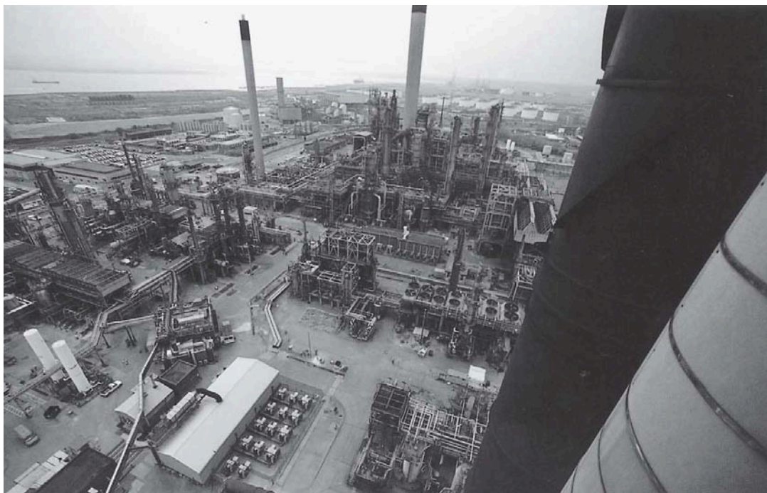
พลังงานจากน้ำมันโรงกลั่นน้ำมัน ที่มา วารสาร นโยบายพลังงาน ฉบับที่ 71 มกราคม - มีนาคม 2549 หน้า 18